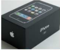
Nuevo iPhone - 17€