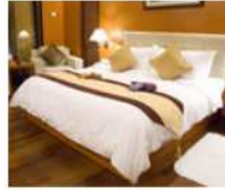
Hotel 4* y 5* desde 35€