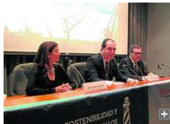
Un momento de las jornadas, ayer en Algeciras.

Una treintena de empresas del ámbito marítimo portuario participaron ayer en la jornada "Cómo ahorrar un 15% en tus tasas portuarias mejorando la gestión ambiental" organizada por la Cámara de Comercio en colaboración con la Autoridad Portuaria de la Bahía de Algeciras (APBA) y del Consejo Andaluz de Cámaras de Comercio. En esta sesión se ha abordado la ecoinnovación y la adopción de sistemas de gestión ambiental como herramientas para el aumento de la competitividad en entornos portuarios.