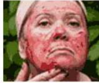
Madre de 53 parece de 27